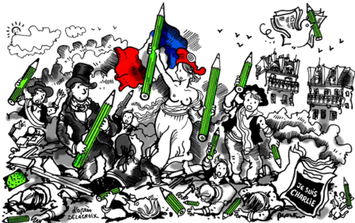
Esta charge foi criada pela rede coletiva Cartooning For Peace (Desenhando pela Paz) que através do humor e dos quadrinhos, luta por liberdade de expressão e diversidade cultural.

que tem fortes atuações em grupos como as do MinasdeHQ, M.A.R, Mátinta, entre outros. Ou também por causas territoriais, que se unem para impulsionar o empreendedorismo local periférico, como O Corre Coletivo, nas quebradas de SP, e o Capa Comics, na Baixada Fluminense do RJ.