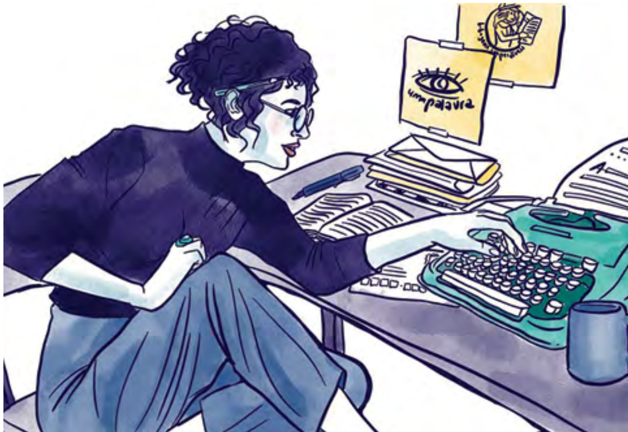
Ilustração: Aline Valek

Ser uma velha sumaúma hoje em dia significa atrair muitos leitores. Sei que se aproximam pelas vibrações da terra, pelo estalido dos passos avançando mata adentro, pisando sobre folhas e galhos. Lá vem eles, um grupo de humanos, tão juvenzinhos, ansiosos pelas minhas palavras. São minúsculos, não chegam à altura das minhas raízes. Inquietos e curiosos, fazem cócegas quando trepam nas sapopembas ou quando afastam as trepadeiras que, feito cortina, escondem o totem instalado em meu tronco. Sei que chamam de Tradutor Generativo, aparelho que precisaram inventar, faz uns 200 anos, para conseguirem entender a linguagem das árvores. É nele que os humanos fixam seus