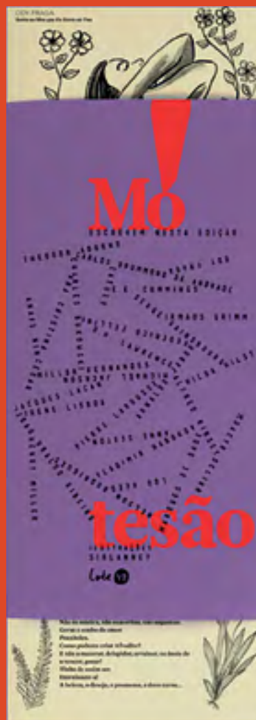
Mó Tesão – Lote42, 2016

CONFIRA, NA PRÓXIMA PÁGINA, A CONTINUAÇÃO DA HISTÓRIA DA EDIÇÃO ANTERIOR.