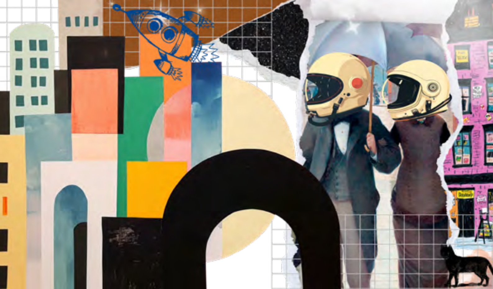
Colagem: Ana Paula Simonaci

O filme Os Doze Macacos , entre tantas ficções, chega a chocar pela previsão de uma pandemia mundial em um tempo tão perto do nosso: é na década de 2030 que a humanidade se encontra condenada a viver no subsolo como resultado de um vírus. Bruce Willis, ao interpretar o papel principal, é James Cole, um homem que, nascido no final dos anos 1980, vê o mundo ser transformado por esta epidemia viral. Ele é enviado ao passado para entender a origem do vírus e obter amostras que permitam aos cientistas desenvolver uma vacina. Para isso, ele precisa desvendar todas as ações que levaram até o confinamento da humanidade.